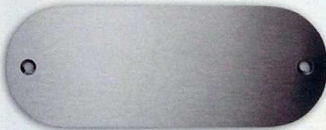
Artikel-Nr. 6010L 160 x 60 mm

Passende Schablone für genaue Positionierung € 6,00