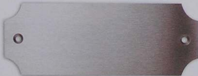
Artikel-Nr. 3010L 160 x 60 mm

Passende Schablone für genaue Positionierung €