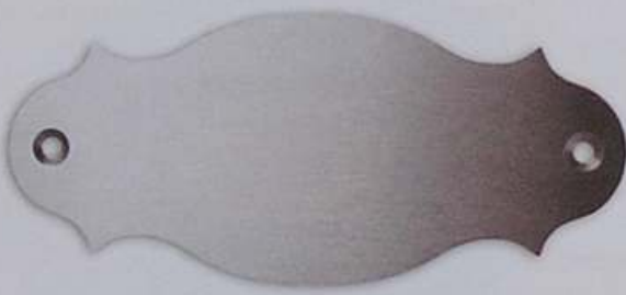
Artikel-Nr. 2010L 140 x 60 mm

Passende Schablone für genaue Positionierung € 6,-