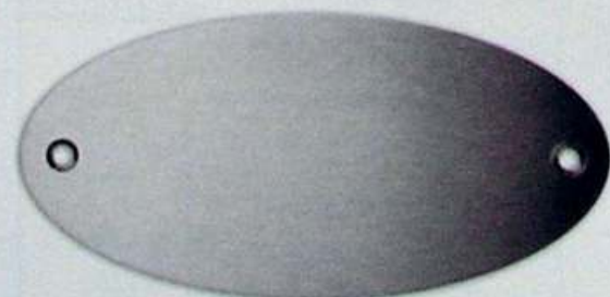
Artikel-Nr. 8010L 135 x 65 mm

Passende Schablone für genaue Positionierung € 6,00