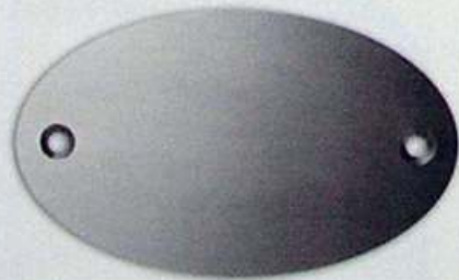
Artikel-Nr. 7010L 100 x 60 mm

Passende Schablone für genaue Positionierung € 6,00