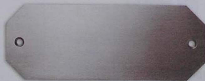
Artikel-Nr. 4010L 160 x 60 mm

Passende Schablone für genaue Positionierung €