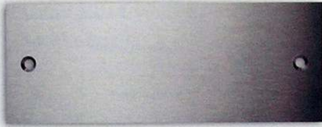
Artikel-Nr. 5010L 160 x 60 mm