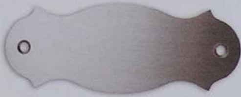
Artikel-Nr. 1010L 120 x 45 mm