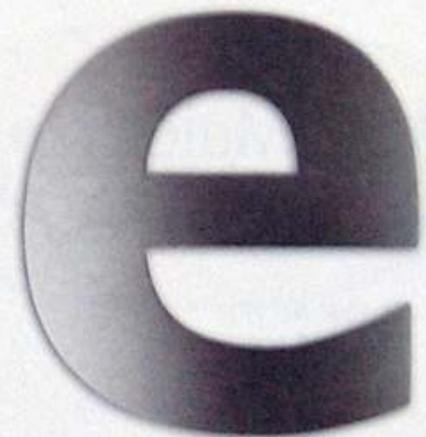
Artikel-Nr. 12010 Höhe ca. 90 mm