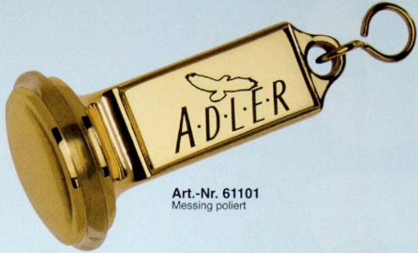
Art.-Nr. 61101 Messing poliert

Preise und Gravurkosten siehe Preisliste