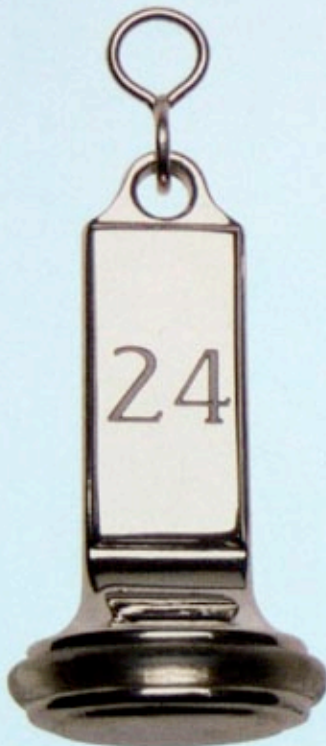
Art.-Nr. 61103 Messing glanzvernickelt

Preise und Gravurkosten siehe Preisliste