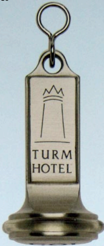
Abb. in Originalgröße