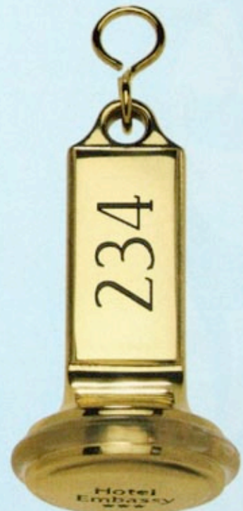
Art.-Nr. 61130 Messing poliert, titanbeschichtet

Dauerhafter Schutz der Oberfläche kann nicht gewährleistet werden!