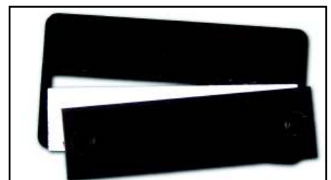
Rückseite Winku-Pro, Größe 67 x 34 mm