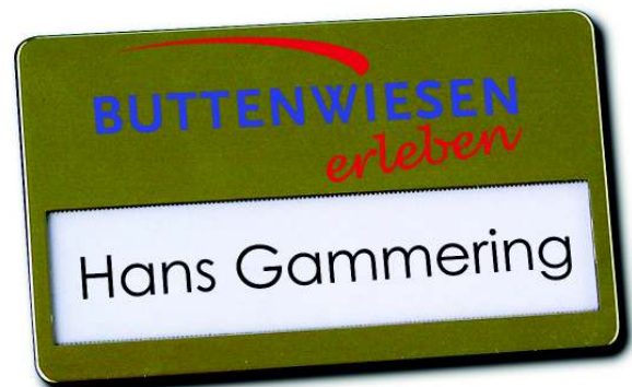
Winku-Pro, Metall-Optik gold, Größe 67 x 40 mm