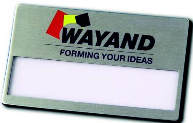
Namensschild Winku-Pro, Metall-Optik silber, Größe 67 x 40 mm