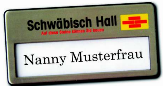
Winku-Pro, Metall-Optik silber, Größe 67 x 34 mm