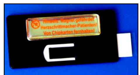
Rückseite Winku, Größe 67 x 34 mm Einschub seitlich