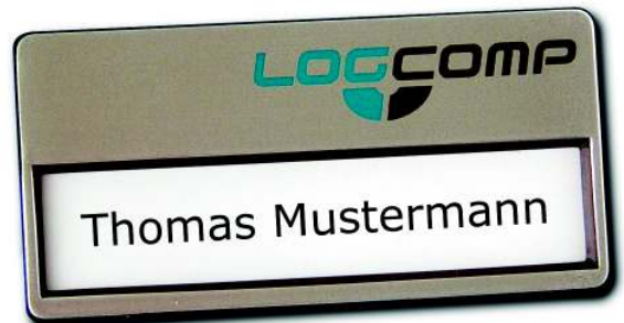
Winku, Metall-Optik silber ca. 67 x 33 mm