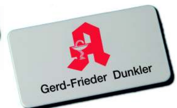
Formatbeispiel 75 x 40 mm