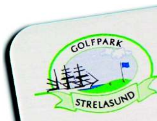
Viele Farben im Logo: Hier optimal gelöst mit Thermoprint-Digitaldruck