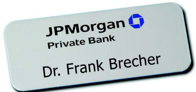
Alugrav 72 x 30 mm R5, Alu silber matt eloxiert, Logo Eloxalunterdruck, Name graviert und schwarz ausgelegt