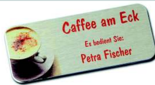
Fotorealistische Darstellung: Hier optimal gelöst mit Thermoprint-Digitaldruck