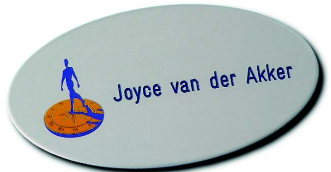
Alugrav 70 x 37 mm , Oval gestanzt, Alu silber matt eloxiert, Logo im Eloxalunterdruck, Name graviert und blau ausgelegt