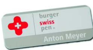
Farbe weiß im Logo: Hier gelöst mit Siebdruck (Logo und Name gedruckt)