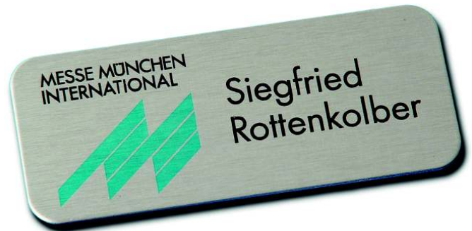
Alugrav 72 x 30 mm R5, Alu edelstahloptik gebürstet, Logo und Beschriftung im Thermoprint-Digitaldruck