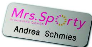
Alugrav in Alu silber glänzend eloxiert mit Eloxalunterdruck und Namensgravur